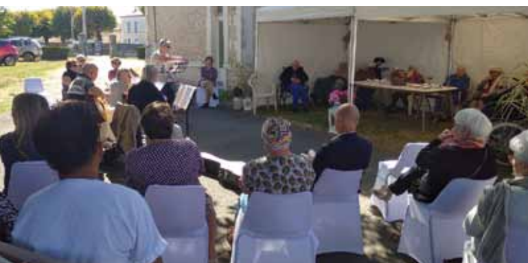
Un moment empreint d'affection pour les familles et de dévouement pour le personnel.

Le samedi 17 septembre 2022 a eu lieu le goûter des familles à l'Ehpad « Les Deux Cèdres ». Suite à la crise sanitaire il n'avait pas été possible de l'organiser depuis 2019.