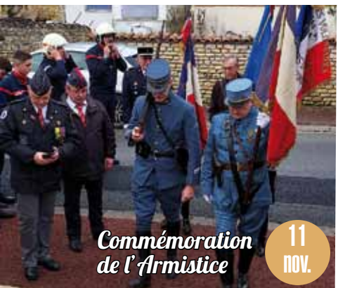
Commémoration de l'Armistice