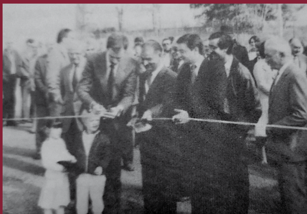
Inauguration de l'école en 1983.

Tout jeune Français dès 16 ans doit se faire recenser pour être convoqué à la Journée défense et citoyenneté (JDC). La période de recensement doit intervenir entre la date de ses 16 ans et à la fin du 3 e mois suivant, à la mairie de son domicile ou en ligne sur www.service-public.fr . Le recensement permet à l'administration de le convoquer qu'il effectue la JDC et de l'inscrire d'office sur les listes électorales à ses 18 ans. La mairie délivre une attestation de recensement qui est obligatoire pour s'inscrire à un examen (BEP, bac...) ou à l'examen du permis de conduire.