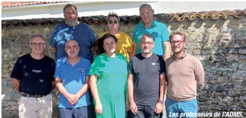
Les professeurs de l'ADMS.

L'ADMS (Association pour le développement musical en Saintonge) est une école de musique agréée par le conseil départemental, créée en 1986, membre de l'ASSEM 17 (Association des sociétés et des écoles de musique de la Charente-Maritime), le siège social se situe à Saint-Hilaire-de-Villefranche. Son rayon d'action se trouve sur les anciens cantons de Saint-Hilaire-de-Villefranche, de Saint-Savinien (Taillebourg et Annepont seulement), de Burie puis quelques communes comme Port-d'Envaux, Ecurat, Plassay, Saint-Vaize, Bussac-sur-Charente, Le Douhet, Fontcouverte, Vénérand et Asnières-la-Giraud.