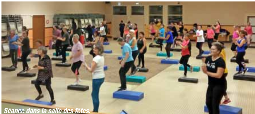
Séance dans la salle des fêtes.

Bilan positif pour l'association Sport Vitalité GV SH 17