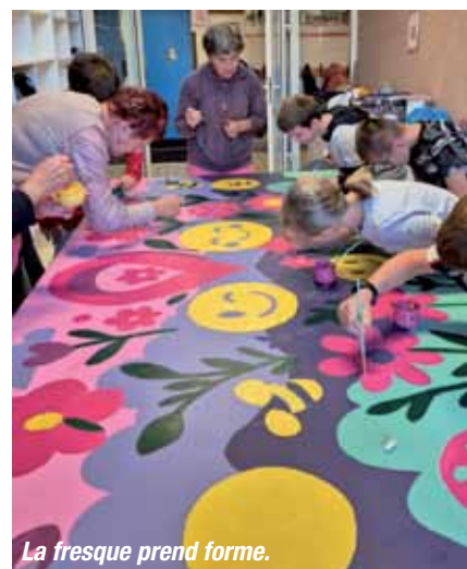
La fresque prend forme.

Une mention spéciale revient aux membres du bureau de l'association, dont l'implication et la bonne humeur ont largement contribué à la réussite de cette édition.