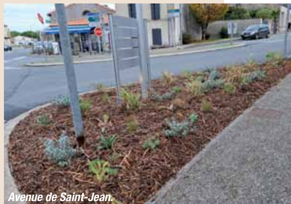
Avenue de Saint-Jean.

La commune accueille également de plus en plus de stagiaires : 950 heures ont été réalisées l'an dernier par cinq jeunes en formation, témoignant du dynamisme et de l'attractivité de Saint-Hilaire-de-Villefranche.