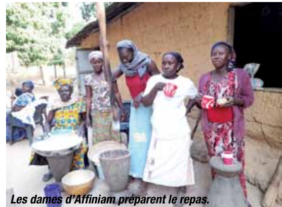
Les dames d'Affiniam préparent le repas.

Notre association, avec le soutien des communes de Saint-Hilaire-de-Villefranche et Nantillé, continue à œuvrer pour un village en Casamance, au Sénégal. Le bénéfice de nos diverses manifestations sert depuis plusieurs années à aider le village d'Affiniam. Nous finançons la cantine de l'école maternelle pour 40 enfants à hauteur de 3 400 EUR pour l'année.