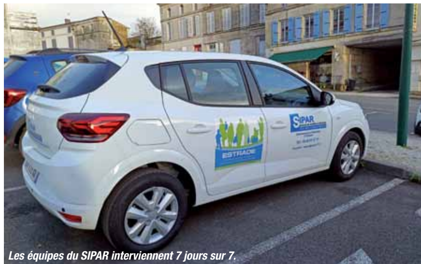
Les équipes du SIPAR interviennent 7 jours sur 7.

Pour la présidente Corinne Etourneau, la mission du SIPAR est simple : permettre à chacun de vivre chez soi en toute sécurité, confort et dignité.