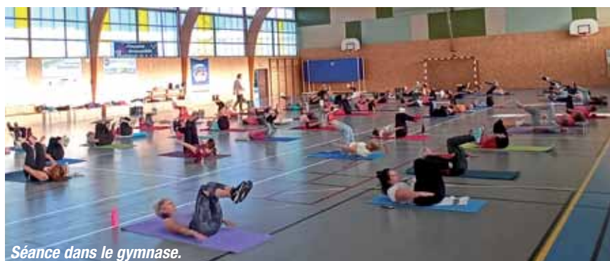
Séance dans le gymnase.